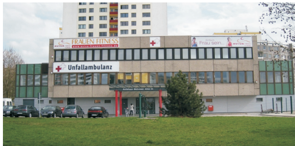
Mehrower Allee 34

Im Erdgeschoss ist eine Unfallchirurgische Praxis mit D-Arzt und Röntgeneinrichtung entstanden. Eine große Physiotherapie mit einem Muskeltherapiezentrum sind bereits etabliert.